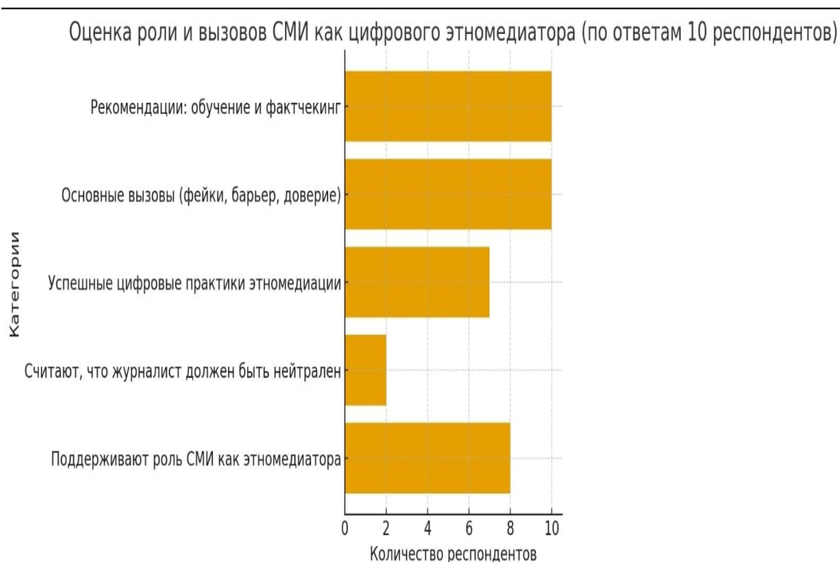
Рисунок – 2. Инфографика по фокус-группе